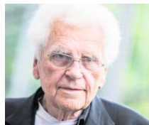
Tankred Dorst.

der Junge 6 ist. Mit 17 wird er kurz vor Kriegsende an die Westfront geschickt und gerät für mehrere Jahre in amerikanische Gefangenschaft. Zurück in der Heimat ist er enturzelt und orientierungslos, bis während des Studiums die Arbeit an einem Münchner Marionettentheater