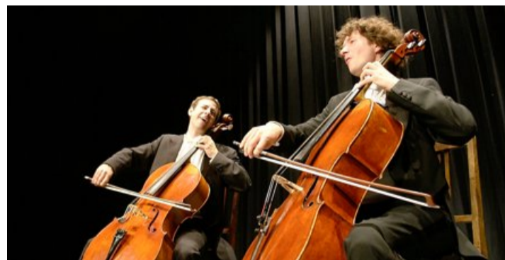
Das Duo Calva tritt am 7. Dezember in Oberhofen auf.

Karten im Vorverkauf bei der Drogerie Jutzi, Tel. 033 243 14 38, an der Staatsstrasse 2 in Oberhofen.