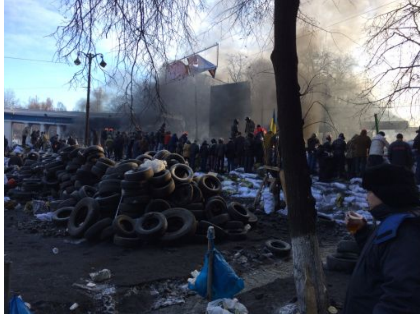
Am Rande des Kiewer Maidans, Winter 2013/14

Für den politisch interessierten Leser zählen die Abschnitte über Gyslings Erfahrungen und Informationen aus erster Hand auf dem Höhepunkt der ukrainischen Maidan-Revolute, den anschliessenden Konflikt um die russische Krim-Annexion und dem weiterhin schwellenden Krieg in der Ostukraine zu den spannendsten Teilen seines Buches. Seine Schilderungen über die Stimmungen, Motive und teilweisen Widersprüche der Euromaidan-Bewegung, die in Kiew im Spätherbst 2013 begann, überzeugen schon deshalb durch hohe Glaubwürdigkeit, weil der Autor diese Ereignisse und ihre Folgen als Reporter während längerer Zeit unmittelbar am Ort beobachtet und analysiert hat.