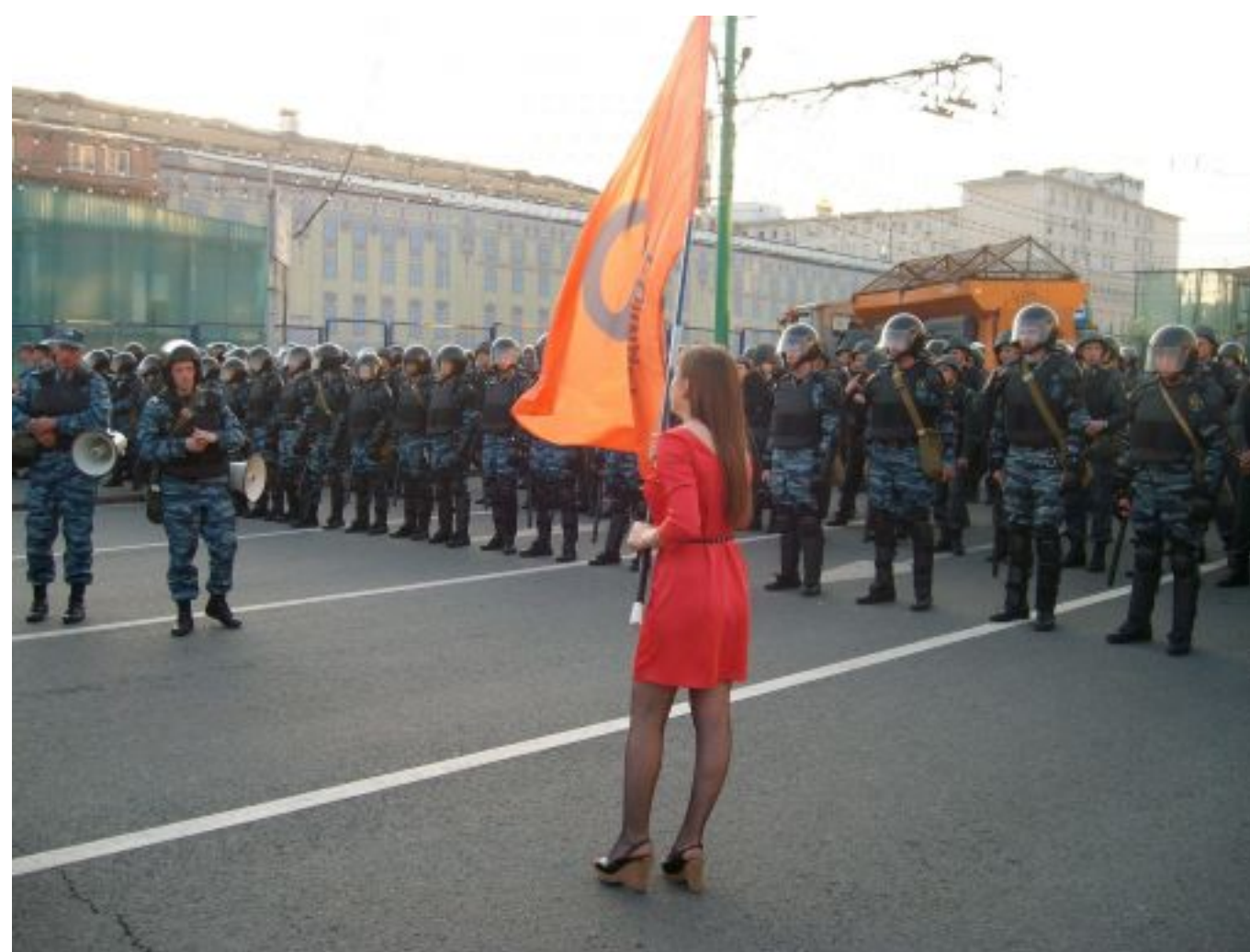
Kräfte messen - Demonstration gegen die neue Amtseinsetzung Putins zum Präsidenten, Moskau 6.5.2012

Mit der Person Putins setzt sich der Autor denn auch in einem eigenen Kapitel mit dem leicht ironisch klingenden Titel „Putin for ever“. Er betont aufgrund seiner langjährigen persönlichen Erfahrungen in diesem Land, dass tatsächlich viele Einwohner der Meinung sind, Putin sei wohl der Einzige, der das multinationale Riesenland zusammenhalten und einigermaßen Stabilität und Sicherheit gewährleisten könne. Die anhaltende breite Zustimmung in der Bevölkerung hat nach Meinung des Autors viel mit der vor allem seit 2012 rasant intensivierten Propaganda im russischen Staatsfernsehen und der gleichzeitig verschärften Repression gegen oppositionelle