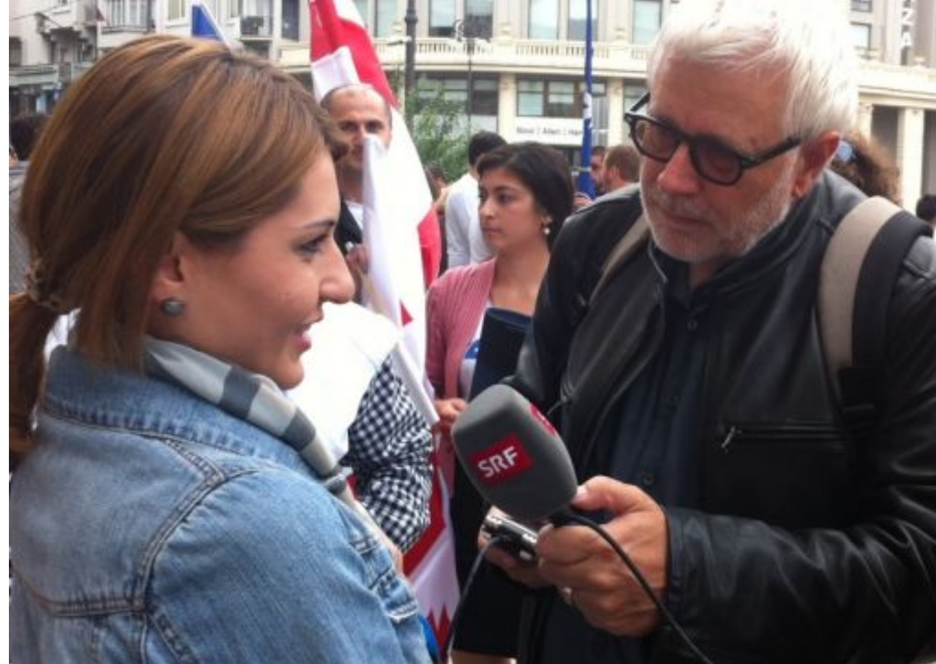
Interview mit einer georgischen Studentin bei einer Demonstration in Tbilissi

Das gilt ebenso für seine Berichte über den kurzen Kaukasus-Krieg von 2008 zwischen Georgien und Russland um die nominell zu Georgien gehörende Provinz Südossetien. Diesen Waffengang hatte der hitzköpfige damalige Präsident Saakaschwili kurzsichtig provoziert und innerhalb weniger Tage verloren.