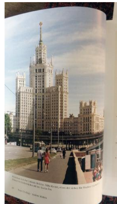
Der Zuckerbäcker-Stil als Zeuge der Stalinzeit.