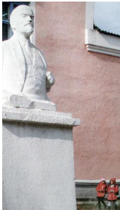
Lenin ist umstritten, aber viele Denkmäler stehen noch.