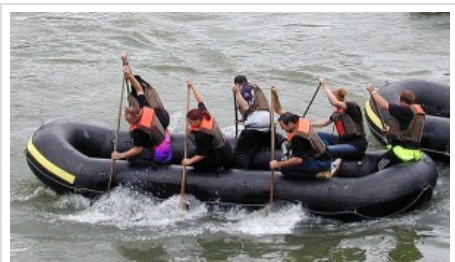
XXL-Gummiboot auf der Aare.

Der Informationsgehalt umfasst Tipps zur An- und Rückreise, Parkmöglichkeiten, Rastplätze und Einkehrmöglichkeiten. Viele dieser Daten sind zudem in einer Übersichtskarte des Tourvorschlags eingearbeitet, auf der auch noch Bilder Ein- und Ausstieg für das Schlauchboot zeigen.