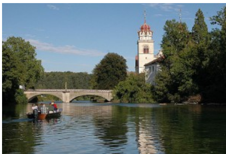
Unterwegs mit dem Boot auf dem Rhein.

Region Klettgau (hüf) Es ist ein spritziges Vergnügen, bei den derzeitigen Temperaturen mit einem Schlauchboot auf dem Wasser unterwegs zu sein. Allerdings braucht es dafür erstens ein paar Tipps und zweitens eine passende Strecke. Zumindest dann, wenn es um Bootsauswahl, das Fahren auf dem Wasser und Hinweise auf geeignete Gewässer geht.