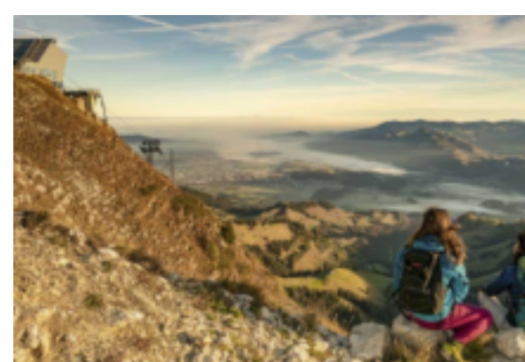
Zum Sonnenaufgang auf den Moléson