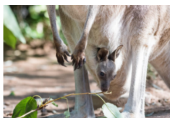
Kängurunachwuchs im Zoo Basel