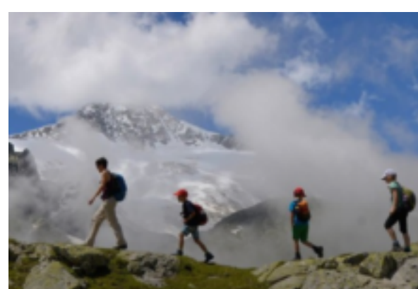
Wandern in und um Andermatt