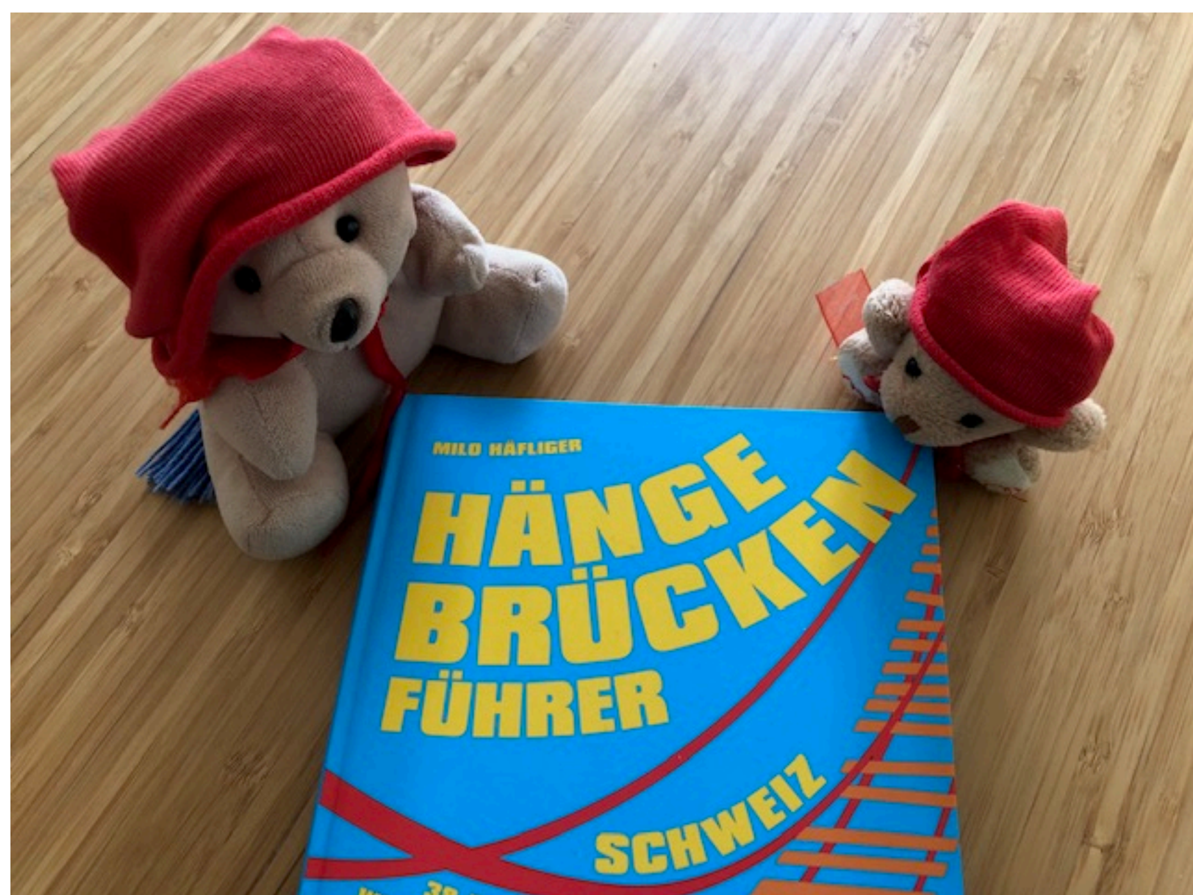
Auf gehts! 38 Hängebrücken in der Schweiz warten darauf, entdeckt und begangen zu werden.