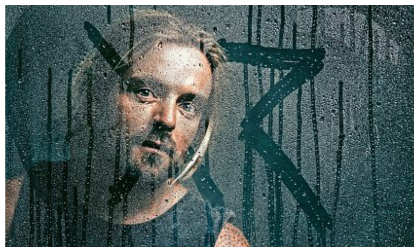
Xavier Rudd singt im Luzerner Saal des KKL tiefgreifende lyrische Songs.

Luzern Wer beim Blue Balls Festival auf der Bühne steht, kann vielleicht nicht das meistgeklückte Video auf YouTube, weltweite Hitparadenerfolge oder ausverkaufte Stadien vorweisen – aber die Musikerinnen und Musiker sind trotzdem herausragend. So mag Samy Deluxe nicht der Deutschraper mit dem grössten Hype sein. Aber technisch und lyrisch gehört er zur allerersten Liga. Cat Power ist vielleicht nicht die Songwriterin, welche die ganz grossen Hallen füllt – aber kaum ei-