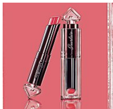
Guerlain im besten Kleid.

La petite robe noir, das legendäre kleine Schwarze, passt immer. Passend dazu liefert Guerlain diesen Frühling frische und aufregende Farben für Lippen und Nägel. Die wunderschöne Verpackung ist schon ein Grund, die Kollektion zu wollen. Aber es gibt noch einige mehr: Die frischen Farben verleihen jedem Auftritt das gewisse Etwas, das «Je ne sais quois». Die Lippenstifte changieren von intensiven Rot-, über dunkle Lila-, bis hin zu frischen Pinktönen. Sie haben eine leichte, glänzende Textur, lassen sich einfach auftragen und leuchten dann in intensiven Farben. Die Nagellacke hat Guerlain, angelehnt an die Verpackung des Hausduftes, in schöne Herzflakons gefüllt. Sie sind dank dem flachen Pinsel einfach aufzutragen, halten lange und – perfekt für den Frühling – duften nach dem Auftragen nach Blumen. pd/sk