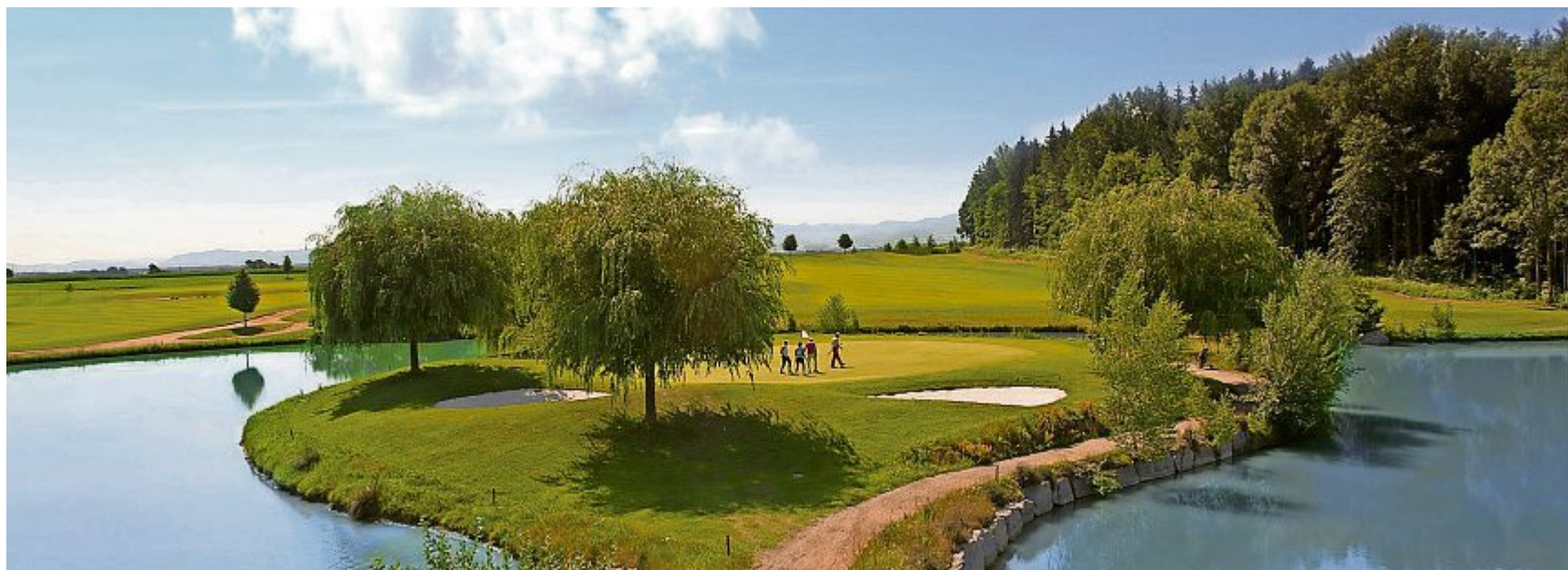
Das Landhotel Schicklberg bietet seinen Gästen mit dem Golfresort Kremstal ein weitläufiges und malerisches Spielfeld.

Wir verlosen 1xRedHeels Nagellack und 1xPinkTie Lippenstift von Guerlain. Schreiben Sie an sandra.scholz@luzerner-rundschau.ch , Stichwort «Guerlain» oder gehen Sie auf www.luru.ch/verlosung . Sie können angeben, was Sie gewinnen möchten.