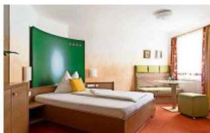
Helle Zimmer und grosse Betten.