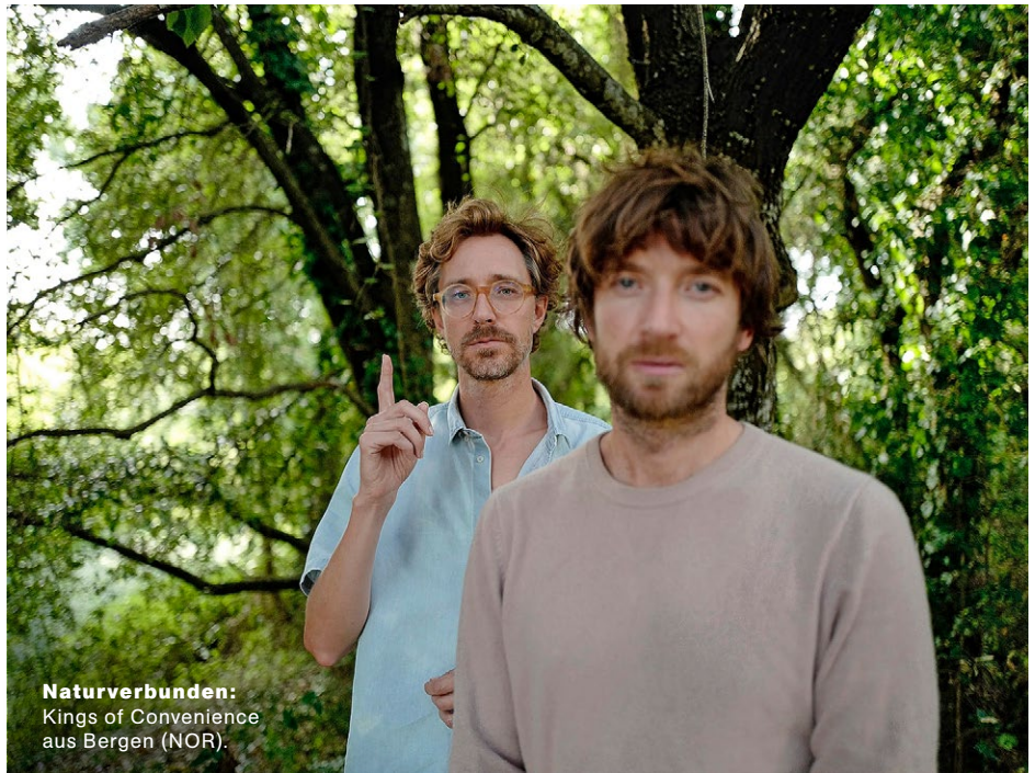
Naturverbunden: Kings of Convenience aus Bergen (NOR).