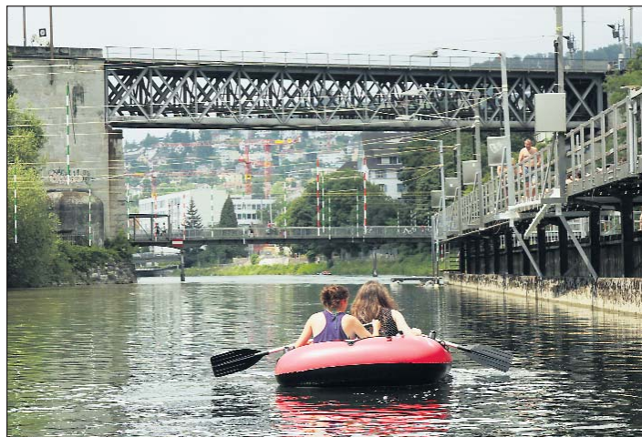
Cool: Die Seele im Gummiboot treibend baumeln lassen

«Es ist der erste Gummibootführer der Welt», erzählte die Autorin dem QE mit berechtigtem Stolz. Und wer noch mehr Fahrten als nur jene auf der Limmat kennen lernen möchte, kontaktiert sie unter dieser Adresse: gummibootfuehrer.ch . QE